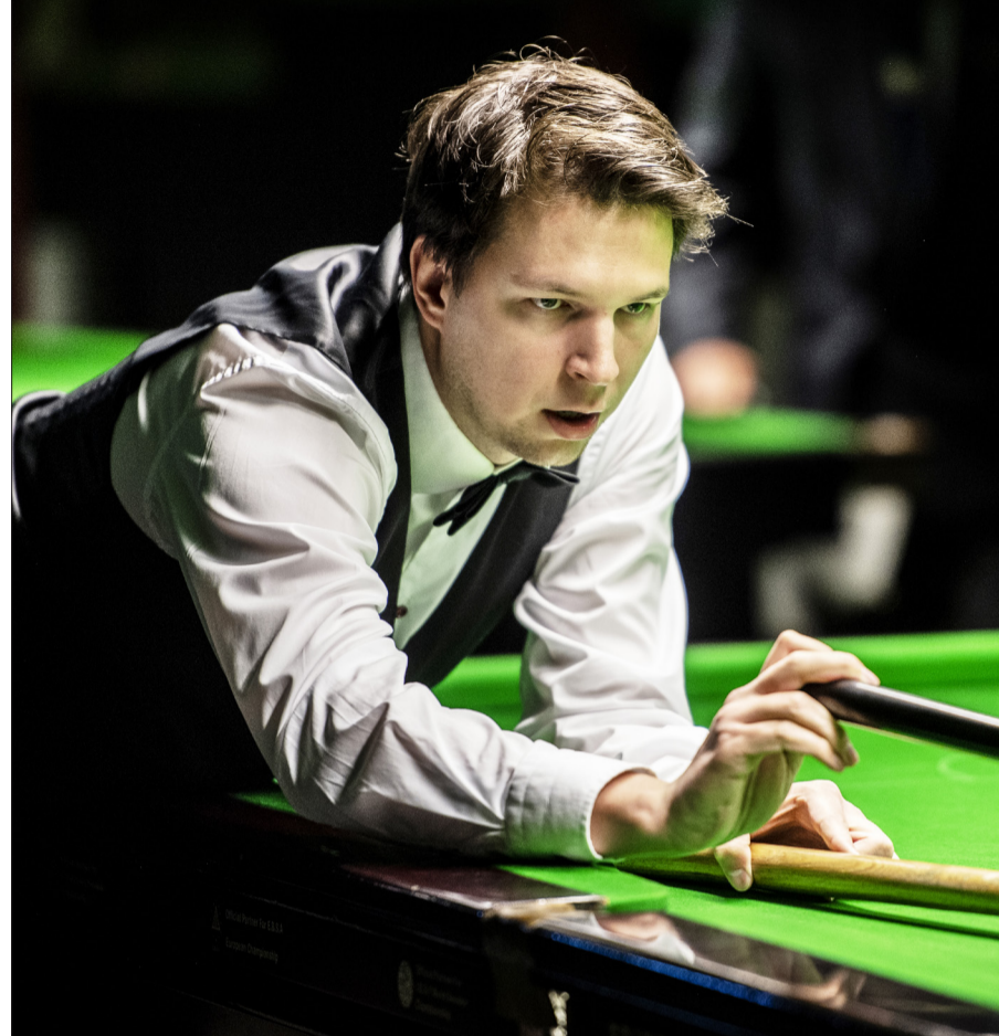
Vinnaren kammar hem 2 500 pund och viktiga rankingpoäng.